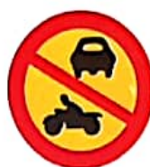
ΑΠΑΓΟΡΕΥΕΤΑΙ Η ΕΙΣΟΔΟΣ ΣΕ ΟΛΑ ΤΑ ΜΗΧΑΝΟΚΙΝΗΤΑ ΟΧΗΜΑΤΑ