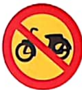
ΑΠΑΓΟΡΕΥΕΤΑΙ Η ΔΙΕΛΕΥΣΗ ΜΟΤΟΠΟΔΗΛΑΤΩΝ