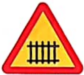
ΠΡΟΣΟΧΗ ΙΣΟΠΕΔΗ ΦΥΛΑΚΤΗΣ ΣΙΔΗΡΟΔΡΟΜΙΚΗΣ ΔΙΑΒΑΣΗΣ