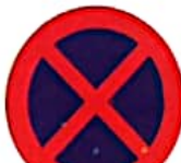
ΑΠΑΓΟΡΕΥΕΤΑΙ Η ΣΤΑΣΗ ΚΑΙ Η ΣΤΑΘΜΕΥΣΗ