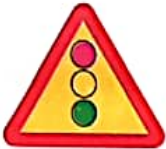
ΠΡΟΣΟΧΗ ΚΟΜΒΟΣ ΜΕ ΣΗΜΑΤΟΔΟΤΗΣΗ