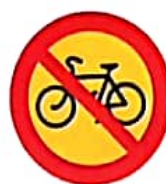
ΑΠΑΓΟΡΕΥΕΤΑΙ Η ΔΙΕΛΕΥΣΗ ΠΟΔΗΛΑΤΩΝ