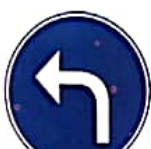
ΥΠΟΧΡΕΩΤΙΚΗ ΠΟΡΕΙΑ ΑΡΙΣΤΕΡΑ