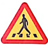
ΚΙΝΔΥΝΟΣ ΛΟΓΩ ΔΙΑΒΑΣΗΣ ΠΕΖΩΝ