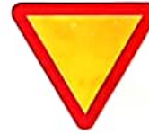
ΥΠΟΧΡΕΩΤΙΚΗ ΠΑΡΑΚΟΡΜΗ ΠΡΟΤΕΡΑΙΟΤΗΤΑΣ