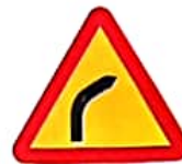
ΕΠΙΚΙΝΔΥΝΗ ΣΤΡΟΦΗ ΔΕΞΙΑ