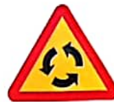
ΥΠΟΧΡΕΩΤΙΚΗ ΠΟΡΕΙΑ ΚΥΚΛΙΚΑ