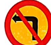
ΑΠΑΓΟΡΕΥΕΤΑΙ Η ΣΤΡΟΦΗ ΑΡΙΣΤΕΡΑ