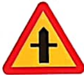
ΔΙΑΣΤΑΥΡΩΣΗ ΜΕ ΟΔΟ ΧΩΡΙΣ ΠΡΟΤΕΡΑΙΟΤΗΤΑ