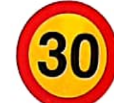
ΑΝΩΤΑΤΟ ΟΡΙΟ ΤΑΧΥΤΗΤΑΣ