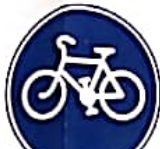
ΔΡΟΜΟΣ ΜΟΝΟ ΓΙΑ ΠΟΔΗΛΑΤΑ