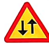
ΠΡΟΕΙΔΟΠΟΙΗΣΗ ΔΙΠΛΗΣ ΚΥΚΛΟΦΟΡΙΑΣ