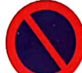
ΑΠΑΓΟΡΕΥΕΤΑΙ Η ΣΤΑΘΜΕΥΣΗ