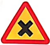
ΠΡΟΣΟΧΗ ΔΙΑΣΤΑΥΡΩΣΗ ΜΕ ΠΡΟΤΕΡΑΙΟΤΗΤΑ ΑΠΟ ΔΕΞΙΑ