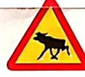
ΚΙΝΔΥΝΟΣ ΑΠΟ ΤΟ ΠΕΡΑΣΜΑ ΖΩΩΝ