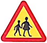
ΚΙΝΔΥΝΟΣ ΛΟΓΩ ΣΥΧΝΗΣ ΔΙΑΒΑΣΗΣ ΠΑΙΔΙΩΝ