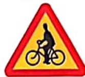
ΚΙΝΔΥΝΟΣ ΑΠΟ ΠΕΡΑΣΜΑ ΠΟΔΗΛΑΤΩΝ