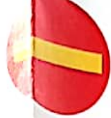
ΑΠΑΓΟΡΕΥΕΤΑΙ ΕΙΣΟΔΟΣ ΣΕ ΟΛΑ ΤΑ ΟΧΗΜΑΤΑ