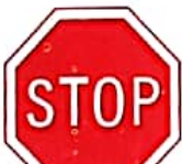
ΣΤΟΠΙ ΥΠΟΧΡΕΩΤΙΚΗ ΔΙΑΚΟΠΗ ΠΟΡΕΙΑΣ