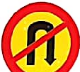
ΑΠΑΓΟΡΕΥΕΤΑΙ Η ΑΝΑΣΤΡΟΦΗ