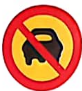
ΑΠΑΓΟΡΕΥΕΤΑΙ Η ΔΙΕΛΕΥΣΗ ΑΥΤΟΚΙΝΗΤΩΝ