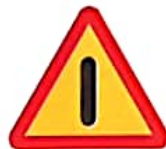
ΠΡΟΣΟΧΗ ΑΛΛΟΣ ΚΙΝΔΥΝΟΣ