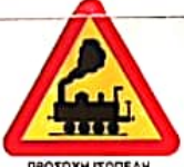
ΠΡΟΣΟΧΗ ΙΣΟΠΕΔΗ ΦΥΛΑΚΤΗΣ ΣΙΔΗΡΟΔΡΟΜΙΚΗΣ ΔΙΑΒΑΣΗΣ